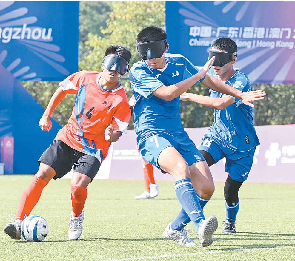
残特奥会盲人足球项目男子组小组赛

组委会副主任、澳门特区政府社会文化司司长柯岚表示，澳门已做好万全准备，迎接八方健儿逐梦赛场、绽放光芒。“让每一位残特奥健儿都能感受到‘莲花宝地’的温暖，让每一份执着与热爱都能得到致敬和喝彩。”