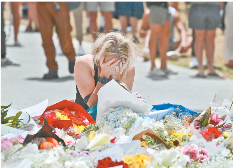
12月15日，在澳大利亚悉尼，一名女子在邦迪滩枪击事件现场附近悼念遇难者。澳大利亚警方15日说，悉尼邦迪滩发生的枪击事件已造成包括1名作案嫌疑人在内的16人死亡、40人受伤。澳大利亚总理内阁部15日发表声明说，根据总理阿尔巴尼斯要求，当天澳大利亚全国降半旗，以悼念枪击事件遇难者。

“犯罪情报”；限制个人持有的枪支数量以及枪支执照和枪支类型；拥有澳大利亚公民身份是获得枪支执照的条件之一。 澳大利亚警方15日通报说，悉尼邦迪滩14日发生的枪击事件已造成包括1名作案嫌疑人在内的16人死亡、40人受伤，两名嫌疑人为一对父子。 这是自1996年塔斯马尼亚州亚瑟港枪击事件造成35人死亡以来，澳大利亚发生的最严重的大规模枪击事件。