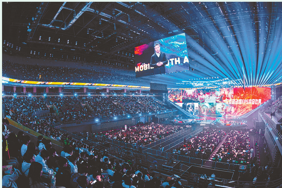
郑州奥体中心比赛现场