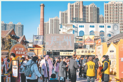
郑州记忆1952油化厂旅游休闲街区活动现场人流

年游客的到来。我想这就是电竞赛事对文旅产业的带动作用。”河南省电子竞技运动协会会长翟霖总结道。