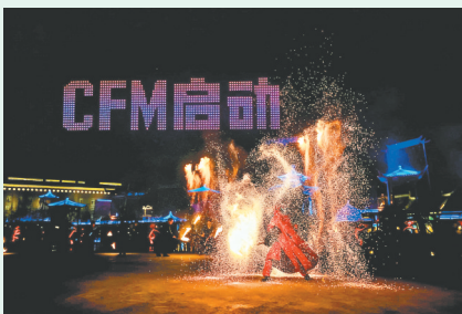
建业电影小镇活动