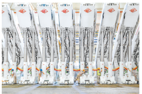
刘银《钢铁机甲阵列》