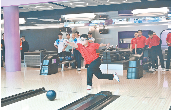
比赛现场

本报讯(记者 陈凯)12月23日,记者从河南省全民健身中心获悉,2025年全国保龄球锦标赛在郑州激战正酣。来自全国23个省、自治区、直辖市及计划单列市的218名保龄球高手汇聚“天地之中”,将在为期一周的赛事中展开激烈角逐,争夺6个项目的桂冠。