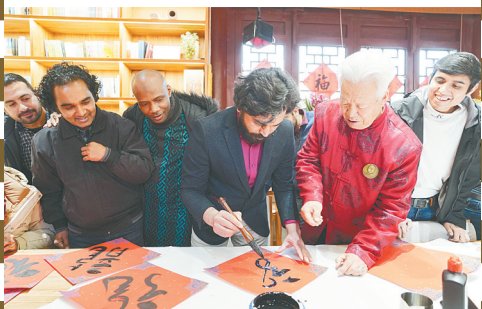
马健《老外爱上中国字》