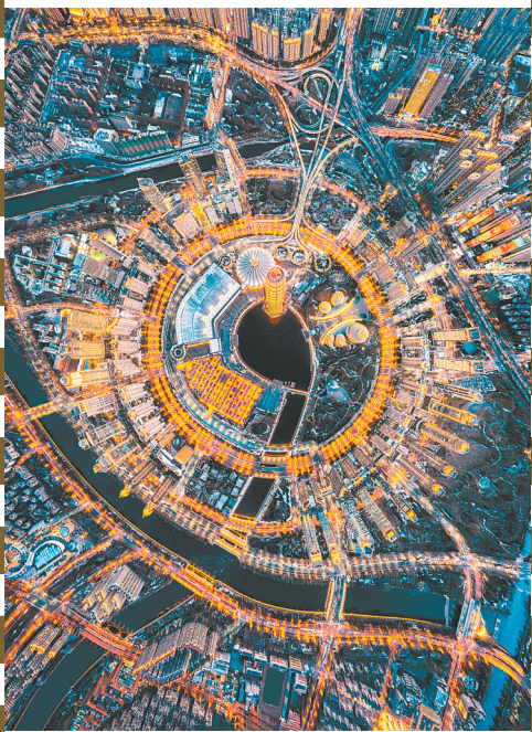
李思翰《郑州城市之眼》