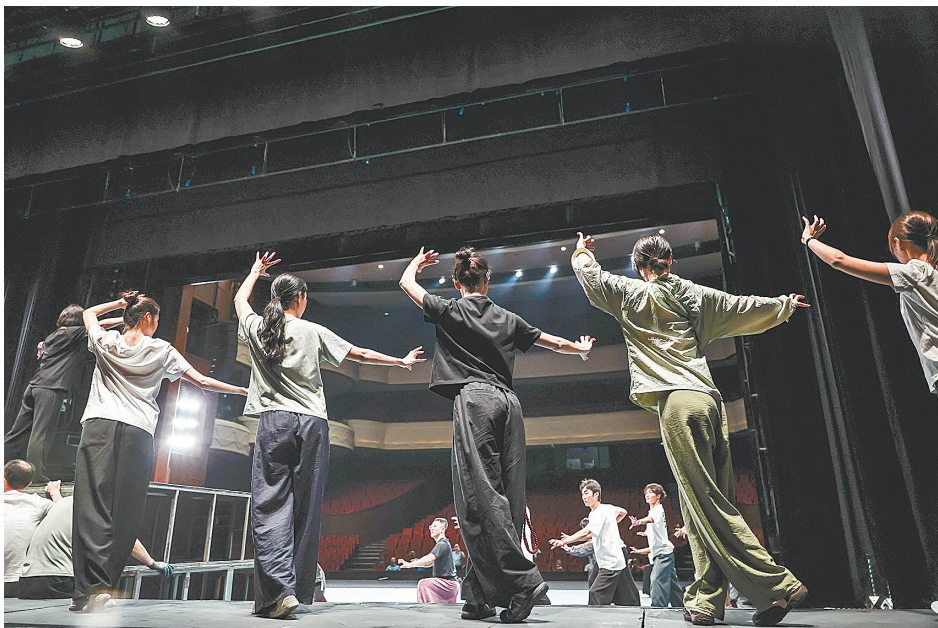
浙江婺剧艺术研究院的演员在排练婺剧《三打白骨精》