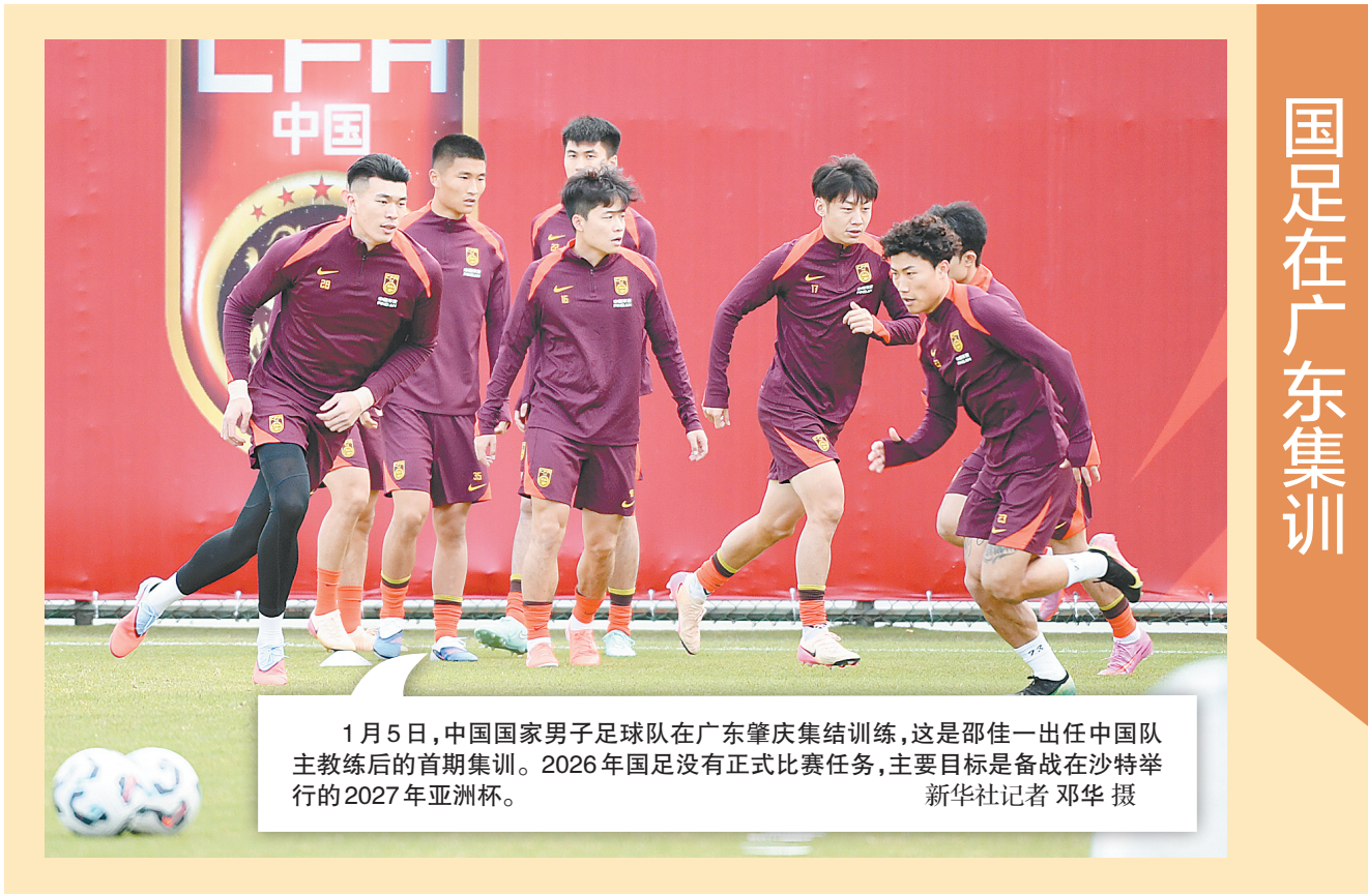
1月5日,中国国家男子足球队在广东肇庆集训,这是邵佳一出任中国队主教练后的首期集训。2026年国足没有正式比赛任务,主要目标是备战在沙特举行的2027年亚洲杯。

在2024年巴黎奥运会上,樊振东获得乒乓球男单和男团金牌,成为包揽世界杯、世乒赛、奥运会单打冠军的大满贯选手。2025年6月1日,萨尔布吕肯俱乐部正式宣布,樊振东将代表该俱乐部参加新赛季比赛。在第十五届全运会上,樊振东获得乒乓球男单冠军,他也成为继马龙后,第二位蝉联全运会乒乓球男单金牌的运动员。