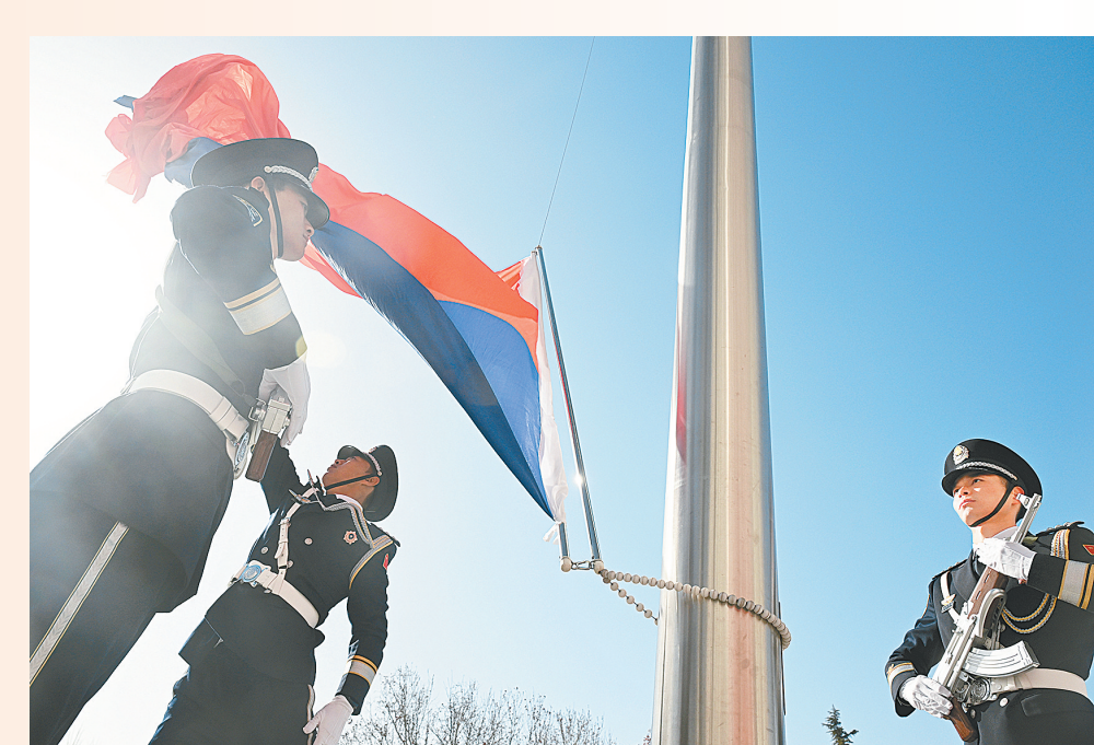
郑州公安举行升警旗仪式庆祝第六个中国人民警察节

2026年的郑商所,将以创新和开放为双翼,持续释放“期市强磁场”效应。这里,既有扎根实体的产业温度,更有链接全球的开放格局;既承载着产业链稳定的专业使命,也履行着传播期货智慧的公共责任。展望前路,这座根植于中原的交易所,将以更优生态培育健康市场,为服务实体经济高质量发展、推进高水平对外开放注入更强期市力量。