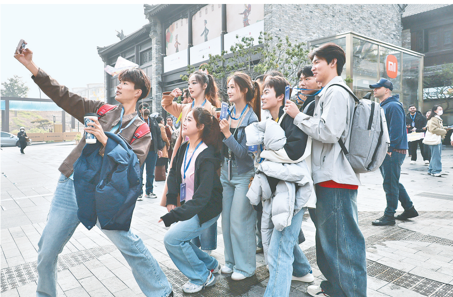
青年在毫都·新象打卡