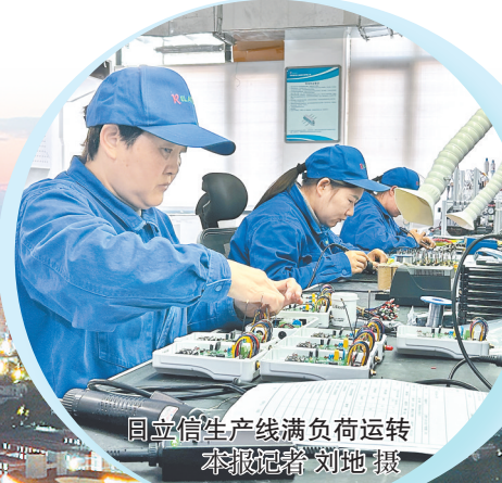
国立信生产线满负荷运转

（上接一版）连续举办七届传感器大会，“中国（郑州）智能传感谷”已成为具有全国辨识度的产业地标。