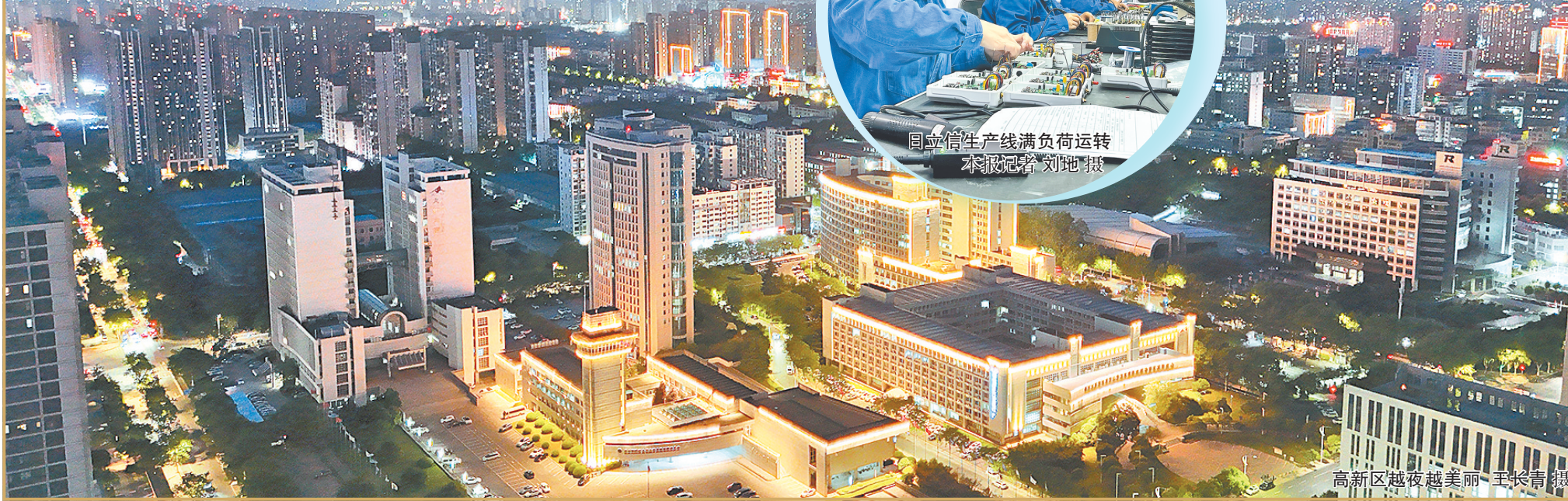
高新区越夜越美丽