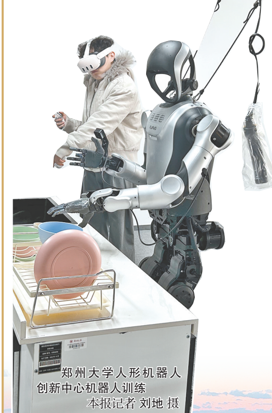
郑州大学人形机器人创新中心机器人训练

产业兴则园区兴，产业强则高新强。郑州高新区立足资源禀赋与时代机遇，精准锚定产业赛道，构建起以智能传感器、超硬材料为主导，智能终端、装备制造、软件、氢能氢燃料电池为战新，算力、人工智能、前沿新材料为未来的“2+4+3”特色现代化产业体系，让主导产业“顶梁柱”更稳，战新产业“增长极”更劲，未来产业“潜力股”更活。