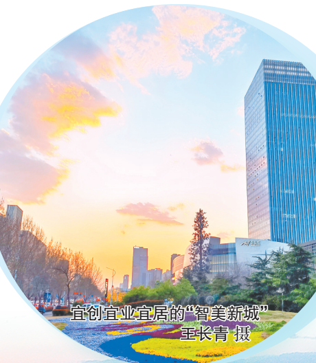
宜创业宜宜居的“智美新城”

区党工委主要负责人表示，将持续做实做好“高”和“新”两篇锦绣文章，以“争创世界一流高科技园区”为目标，以促进科技创新和产业创新融合为主线，以深化改革创新为动力，一体推进教育科技人才改革发展，全力打造具有竞争力的“创新高地、先进制造业高地、人才高地、科技金融高地和营商环境高地”，努力在奋力谱写中原大地推进中国式现代化新篇章中作出高新贡献。