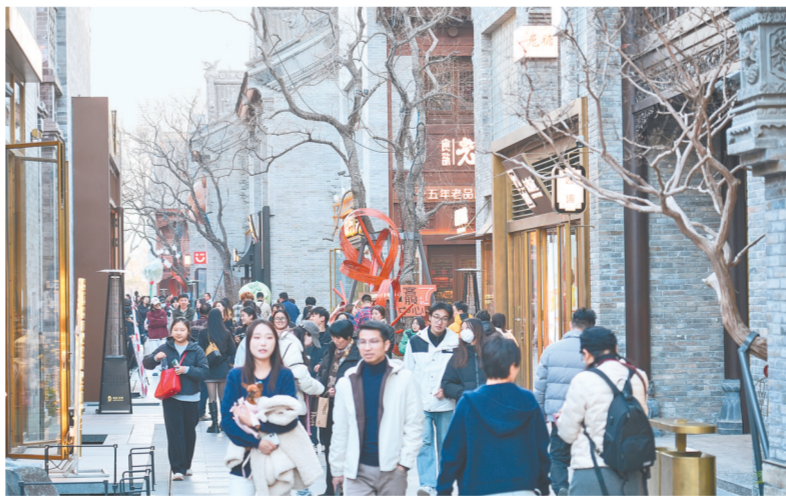
亳都·新象融合 3600 商都文脉与现代商业活力,吸引大量游客前来畅玩打卡

从乙巳蛇年春节假期开始,全市文旅产业就显现出消费足、人气旺的假日特点。作为首个“世界非遗”中国年,2025乙巳蛇年期间,郑州文旅以“见‘郑’欢喜年”为主题,策划推出了大美非遗、春漾花灯、“艺”起入戏、普惠万家等一系列文旅活动,围绕“老家河南 郑州过年”“2025·见郑欢喜年”等相关话题全网阅读量超5000万人次,为全年“文旅热”完成开篇。 芳菲季节,花样游“园”。当春节的“文旅热”延续到春暖花开,芳菲满园,文旅市场依旧精彩。在