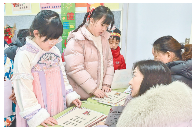
二七区兴华街第二小学萌娃自信闯关

经开区朝凤路小学一、二年级综合素养评价活动则以“科技探索”为主题,现场布置了机器人模型、空间站展板等,营造出沉浸式科技氛围。学生们化身“小小科学家”,佩戴自制科技头饰,在涵盖多学科的趣味任务中进行素养比拼。“汉字星际探索站”带领孩子们开启了一场声光交织的语文太空环游之旅;在数学天地里,小探险家们开启了一场贯穿运算、图形、数感、比较与应用的完整数学旅程;在美术星绘创想坊,孩子们以童真的视野和灵巧的双手,创作出一系列充满年味与创意的艺术作品,为校园增添了浓厚的节日氛围;在体育星能跃动站,孩子们在运动中收获的不仅是体能的提升,更是勇气与毅力的成长……此次活动整合了科学实验、英语交际、劳动技能、艺术创作以及体育测试等内容,全面评价学生的综合素养,旨在通过活动,在孩子们心中播下好奇、求真、向善的种子,赋能未来成长。