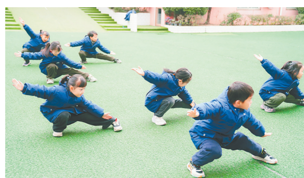
金水区世纪先锋学校五年级拳展演精气神十足