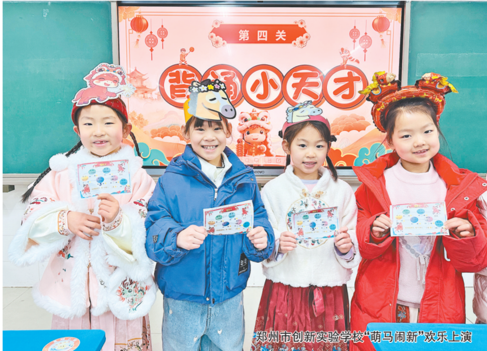
郑州市创新实验学校“萌马闹新春”欢乐上演

郑州陈中实验学校的期末测评,是一场融合了AI技术、文化传承与生活情境的创新实践。各校区采用形式多样的闯关活动,让教育回归生命滋养的本质,让每一次闯关都成为成长的拔节声。迎宾路校区开展“萌娃趣闯关”,孩子们头戴自制头饰,在“口算小达人”“识字加油站”中灵活运用所学;平顶山校区的“福气小骏马”闯关,则将拼读、计算、表达融入“生活小剧场”,让孩子们在模拟的“购物问路”情境中解决问题;迎东校区围绕“萌马”主题,设计了“计算小状元”“听音小侦探”等关卡,将学科知识融入马年新春场景;荣阳校区则用“诗词转盘”游戏,让孩子们在“转一转”中背诵经典。学校还将AI技术深度融入测评,可由AI生成游戏化题目并适配难度,实现了从经验评价到科学赋能的跨越。