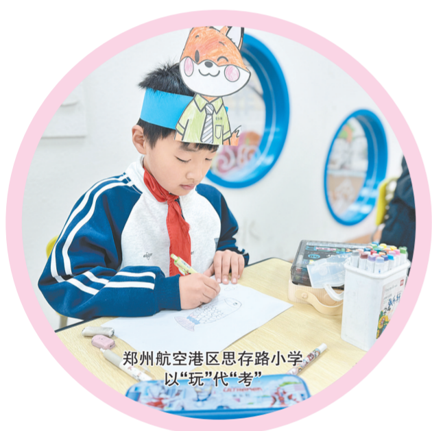
郑州航空港区思存路小学以“玩”代“考”

期末季悄然而至,我市各小学的期末测评现场处处洋溢着欢声笑语。为深入贯彻“双减”政策,推动教育评价改革,各校纷纷创新形式,打破传统纸笔测试的边界,将测评融入丰富多彩的闯关游戏和实践活动中。孩子们在情境中巩固知识,在合作中展示素养,一场场别开生面的期末测评,正成为助力学生全面成长、检验学校育人成效的重要方式。