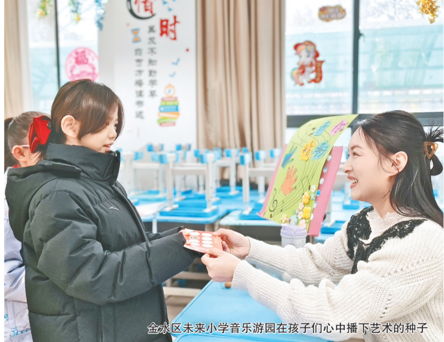
金水区未来小学音乐游园在孩子们心中播下艺术的种子