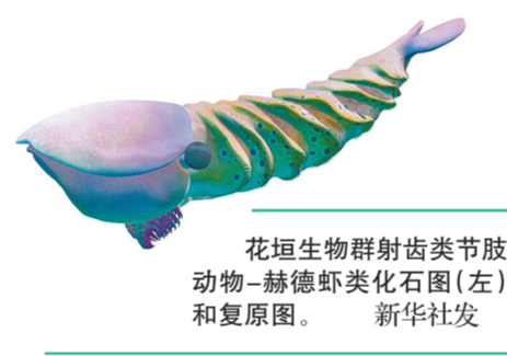
花垣生物群群齿类节肢动物—赫德虾类化石图(左)和复原图。

1月22日，在中国科学院南京地质古生物研究所显微CT实验室，中国科学院院士、研究员朱茂炎(右一)，副研究员曾晗(左一)和同事观察扫描出来的化石图。