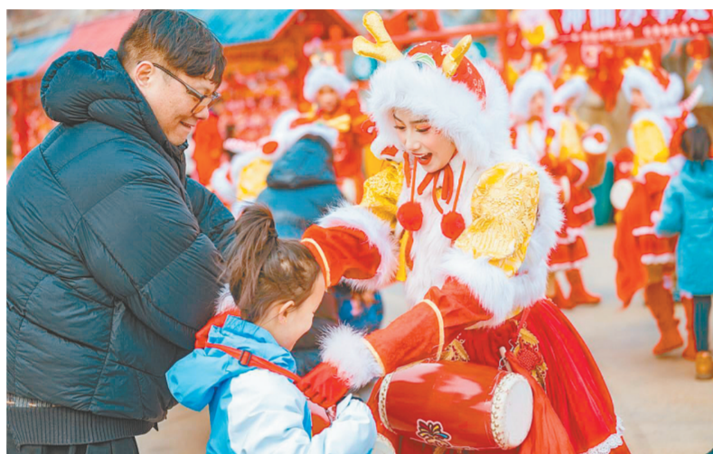
银基国际旅游度假区演员NPC和游客快乐互动(资料图片)

本报讯(记者 李居正文/图)马年春节将至,1月30日,记者从郑州银基国际旅游度假区了解到,该景区将于2月10日至3月8日推出“百兽闹春”大型节庆活动。活动融合传统民俗、主题游乐与暖心服务,打造一个全场景、沉浸式的春节度假目的地,诚邀市民游客前来度过一个“年味”十足的新春佳节。