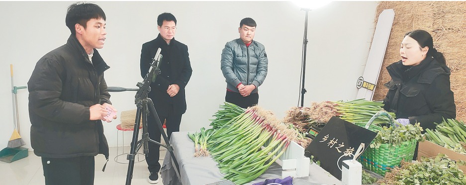
一蔬菜直播间正在卖中牟蒜苗和香菜

此前,社区网格员夜间走访时发现,澳林春天无主管楼院原有路灯损坏,夜间道路昏暗,给居民出行带来不便,更给老人、儿童夜间活动带来安全隐患。社区第一时间响应,将路灯安装纳入“我为群众办实事”项目。社区秉持全覆盖、保安全、省成本原则,全面排查照明风险点,科学规划路灯点位与数量,同时广泛征求居民意见,最终选用节能环保、亮度稳定、无须复杂电网改造的LED太阳能路灯。施工期间,社区工作人员全程监督,及时协调解决施工难题,保障安装工作高效推进。