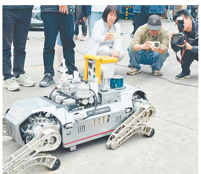
“七腾机器人”引人注目，它主要服务于应急安全终端市场