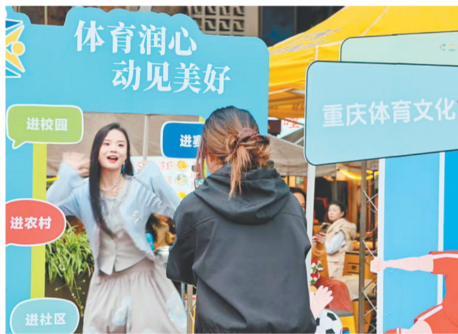
重庆民主村社区，年轻人正在“打卡”

据悉，中央网信办、工业和信息化部、公安部将会同相关部门有序推进系列专项行动中的各项任务，集中整治各类典型违法违规问题，对情节严重、拒不整改的依法从严处理；同时，有关部门将根据实际工作需要动态调整重点治理问题，确保专项行动取得实效。