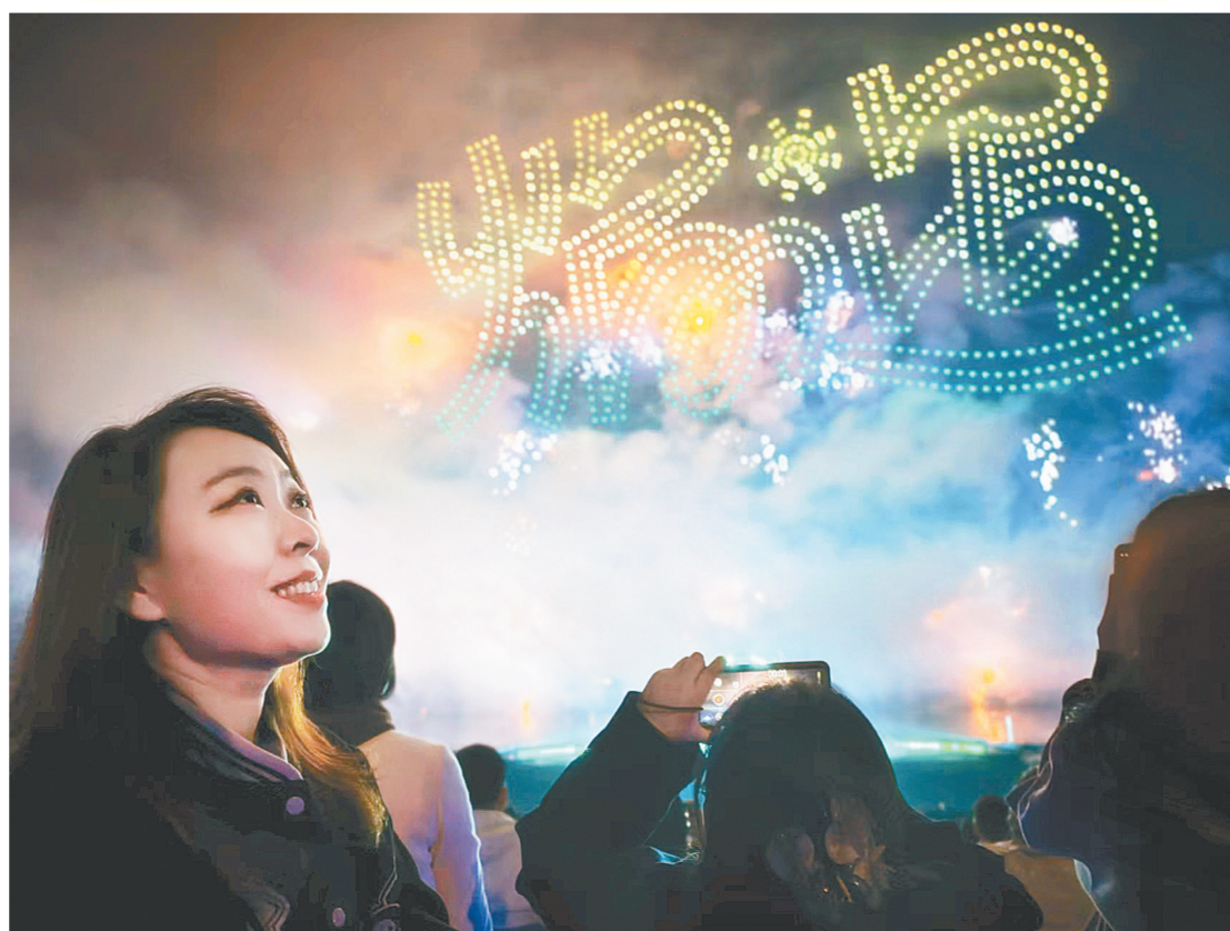
“焰遇·重庆”春日火花艺术季作为全国首个烟花文旅IP，绘就山城春日浪漫

3月29日，“强信心·看发展——镜头里的新重庆”全国主流媒体摄影记者重庆采风活动圆满落下帷幕。几天里，采风团队穿梭于这座山水之城的物流枢纽、城市社区、文旅场景、产业基地和AI智能工厂，中国式现代化在重庆的生动实践在快门声中被逐一定格。来自全国各地的主流媒体摄影记者与重庆本土的影像创作者，通过镜头见证了一座内陆城市如何以开放拥抱世界、以更新守护民生、以创新驱动未来。