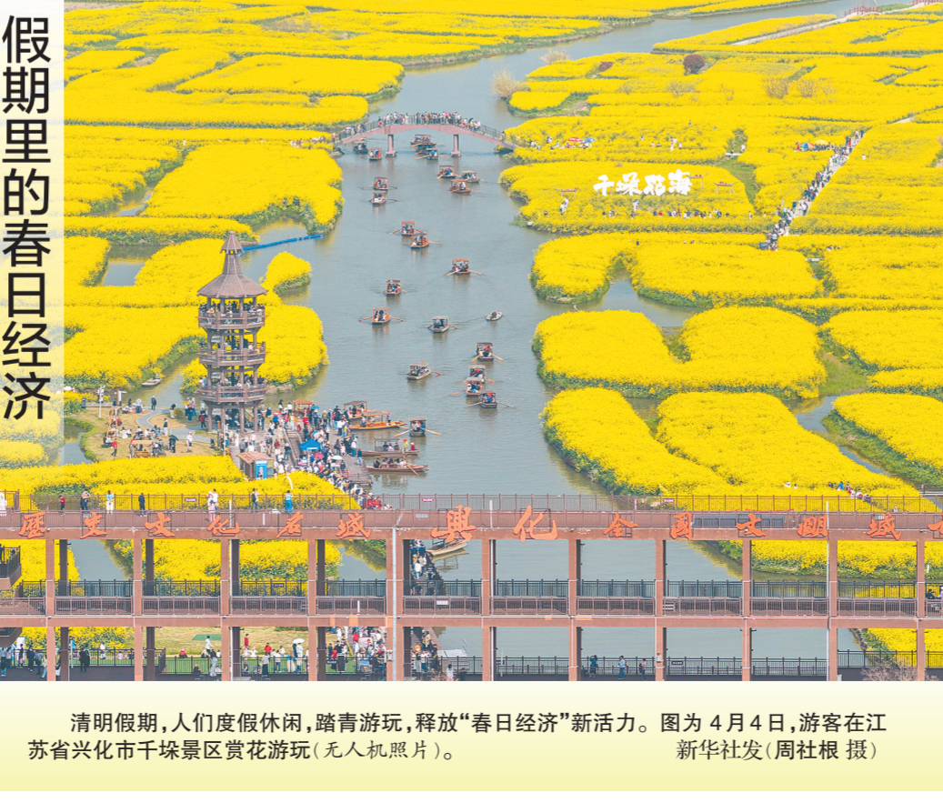
清明假期,人们度假休闲,踏青游玩,释放“春日经济”新活力。图为4月4日,游客在江苏省兴化市千垛景区赏花游玩(无人机照片)。