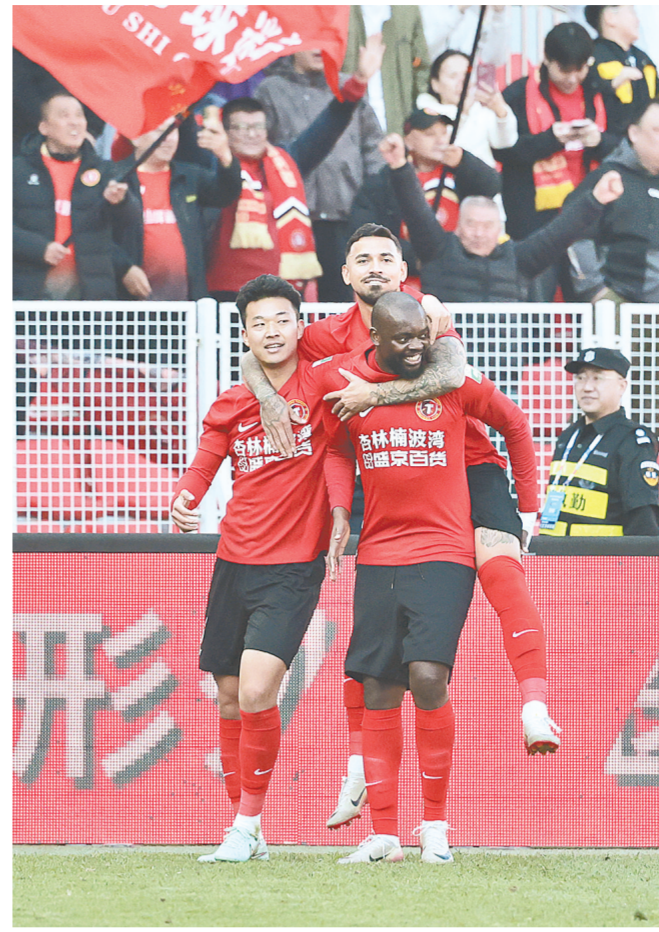
4月4日,在沈阳举行的2026赛季中国足球超级联赛第四轮比赛中,辽宁铁人队主场2:1战胜北京国安队。图为辽宁铁人队球员庆祝进球。