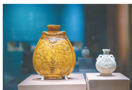
白釉兽面纹双系扁壶