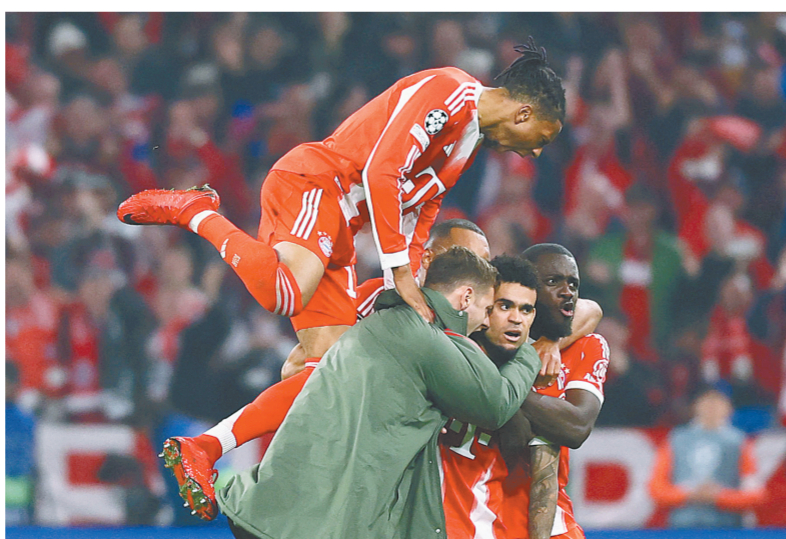
拜仁慕尼黑队球员迪亚斯(右二)在进球后与队友庆祝