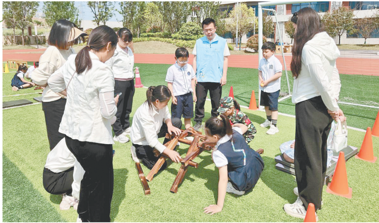
科技运动会上的趣味互动实验

根据检查结果,市市场监管局已向京东外卖、美团、淘宝闪购3家外卖平台发出敦促提醒函,要求对平台内存在违法违规行为的8家商户立即采取暂停线上交易、商品下架等处置措施,坚决守住网络餐饮安全底线。市市场监管局相关负责人表示,对检查发现的问题将“一盯到底”,确保整改到位、平台处置到位。