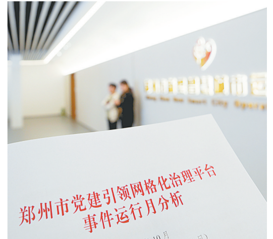
郑州市每月编发党建引领网格化治理平台事件运行月分析，寻找问题、提升管理

“四种模式”的创新应用，让郑州的基层治理告别了“一套方法用到底、一种状态管全年”的僵化模式，实现了因时制宜、因地制宜、因事制宜，让治理更有温度、更具韧性、更显智慧。