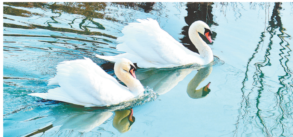
北龙湖疣鼻天鹅“王子”和“公主”

2020年5月,“王子”“公主”在窝孵化6个天鹅宝宝,是郑州首次野生疣鼻天鹅城市