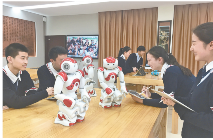
郑州市第二高级中学学生与机器人互动