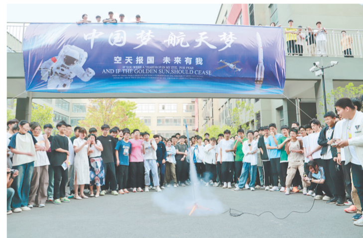
郑州市第十六高级中学学生展示科创作品

科技兴则教育兴,创新强则少年强。我市高中科学教育已形成特色鲜明、成效显著、示范引领的良好局面。下一步,我市高中将继续以科学教育为引擎,深耕课程改革,强化实践创新、深化协同育人,用心培育具备科学素养、创新精神与家国情怀的时代新人,为中原教育高质量发展、为科技强国建设注入源源不断的青春动能。