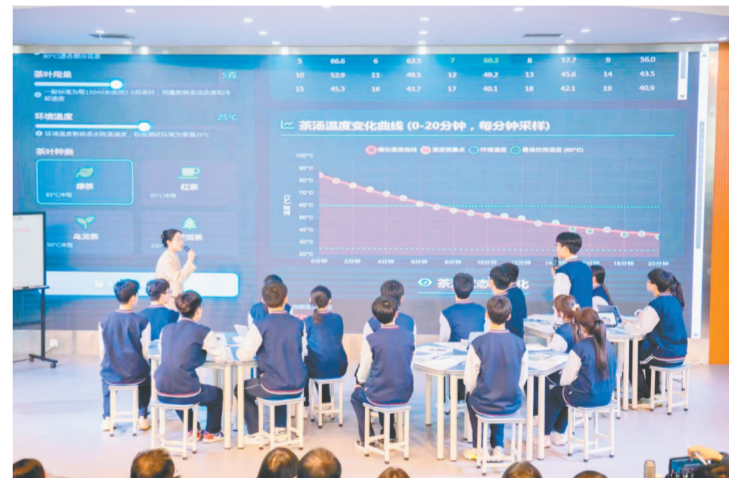
郑州市第十一中学AI赋能课堂