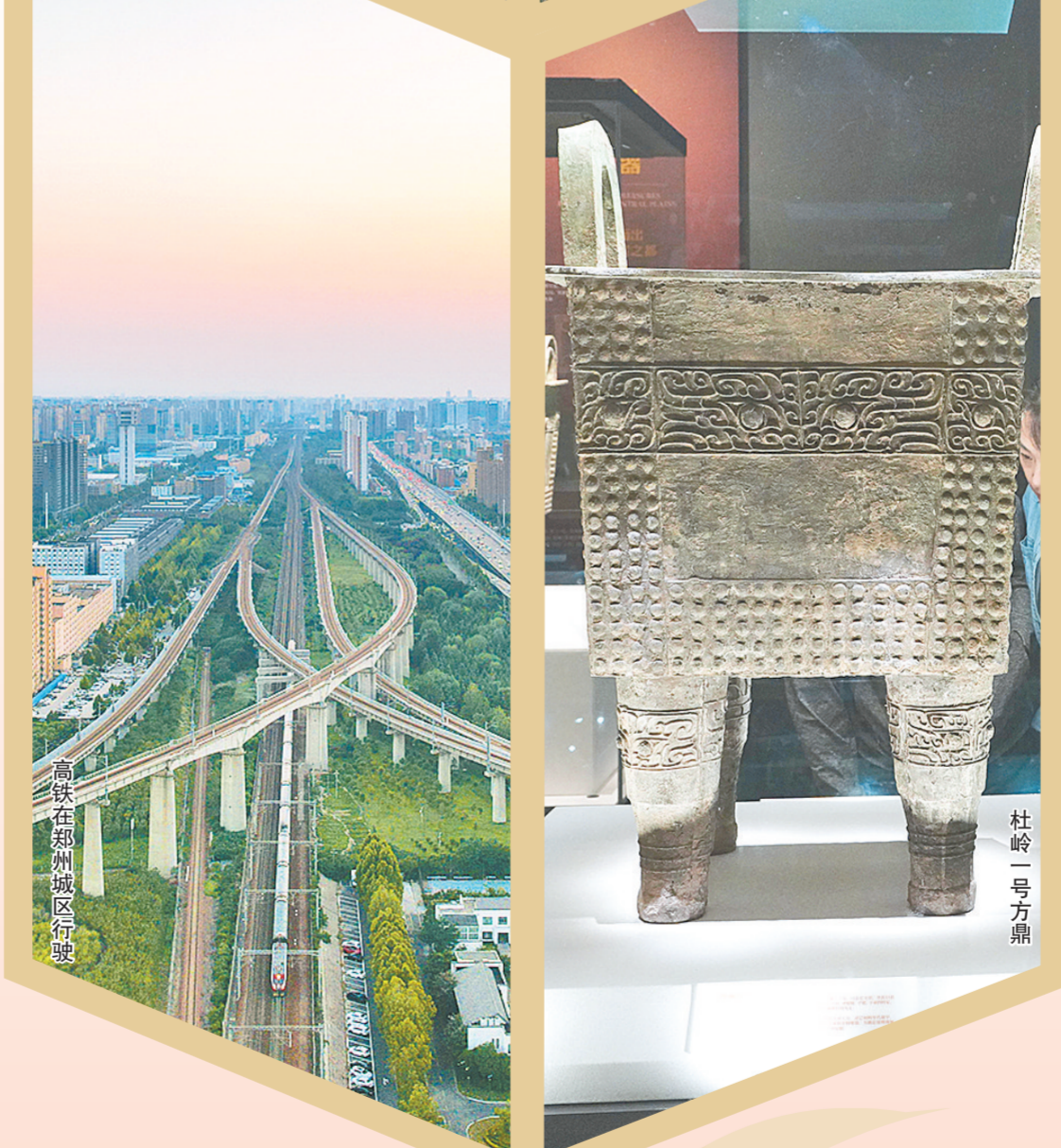
高铁在郑州城区行驶