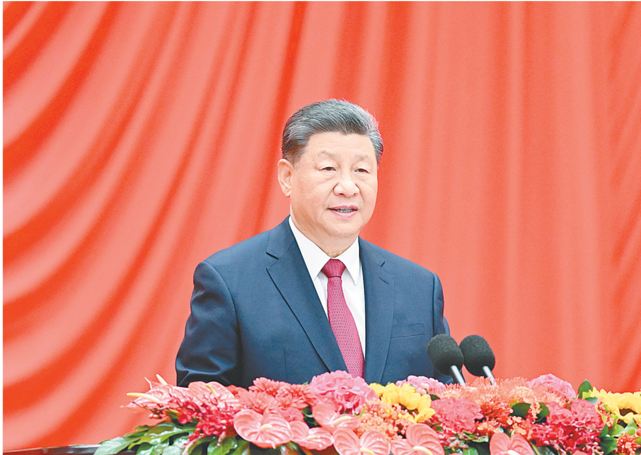
9月30日晚,庆祝中华人民共和国成立75周年招待会在北京人民大会堂隆重举行。中共中央总书记、国家主席、中央军委主席习近平出席招待会并发表重要讲话。