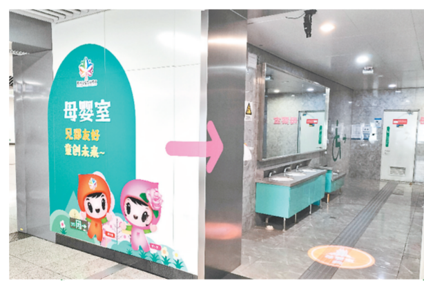
母婴室配备多种设备，为宝妈出行提供便利