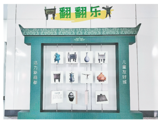
以“商都文化”为主题的南五里堡站

本报讯(记者 杨丽萍 杨柳 图)记者昨日从市妇联获悉，近日，黄河南路站、南五里堡站、儿童医院站3个儿童友好主题地铁站正式亮相，站内鲜明的主题、有趣的创意，吸引大批儿童及市民驻足体验。