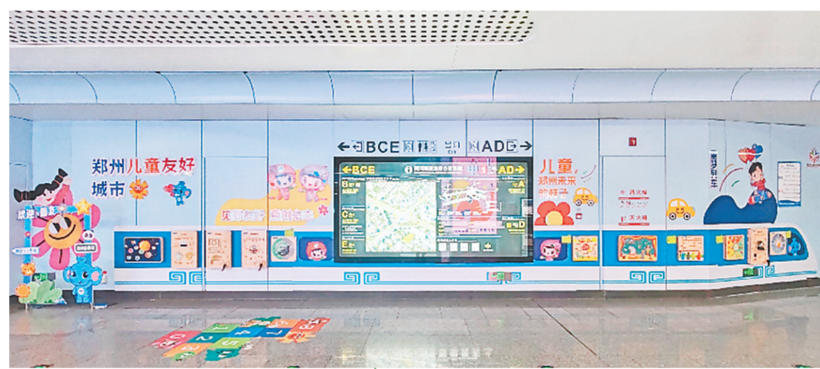
儿童友好主题地铁站正式亮相